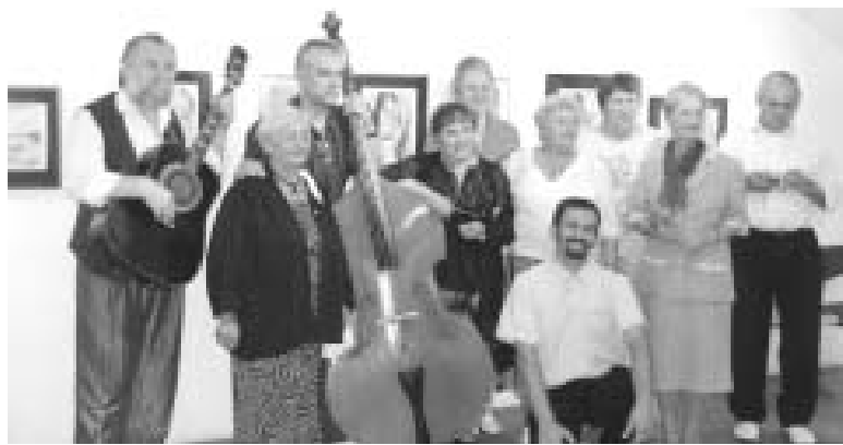
A TEG alkotói közössége és a vendég