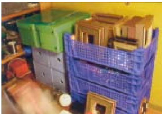
Ett gäng ramar väntar på sitt innehåll.

Utrustad med verktyg började hon med att bända bort kylflänsen och så tog hon upp en liten underlig pryl. Då slog det henne hur vackra sakerna var. Den