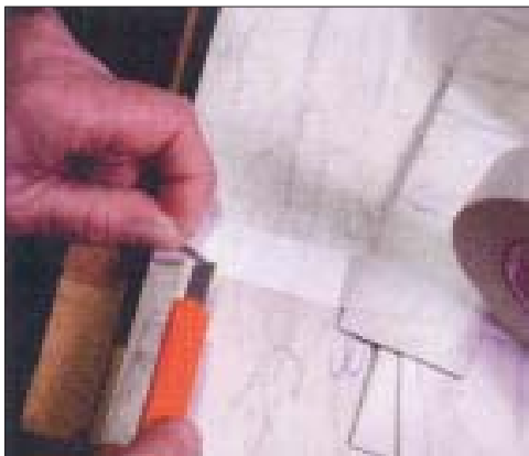
Beates konst kräver fingerfärdighet.