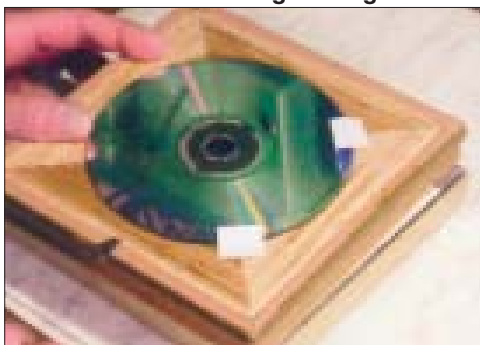
En cd-skiva blir en bakgrund.