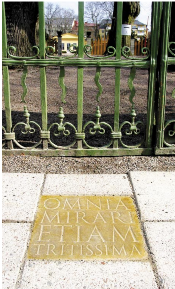
Entrén till Linnéträdgården i Uppsala.