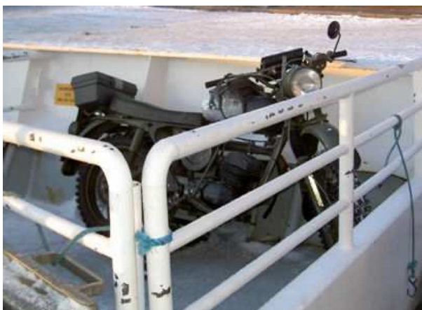
Den gamla Husqvarnan på väg hem på Waxholm II

Så är festen över och efter en kopp kaffe tar jag motorcykeln till Dalarö för att åka hem. Brukar normalt åka från Årsta Brygga men vinner tre timmar på att åka via Dalarö. Men visst tvekar jag, för nu måste jag ta hojen med mig på båten och med Waxholmsbolagets taxa kostar det 181 kronor, nästan lika mycket som biljettpriset för tre vuxna passagerare. Ett led i det populära uttrycket "levande skärgård" ni vet. Kunde kanske välja att skicka den från Nynäshamn till Visby för bara 154 kronor. Men jag är ju knäpp nog att bo på Utö och inte på Gotland. Hmmm, kanske en tanke?