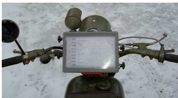
Vy över "cockpit" med roadbook, reglage och mörkläggningslampa. Notera de två bromshandtagen – med ett påverkar man bakbromsen när foten hålls på skidan.

Rallyt startade med tidskörning på en kort pilad slinga runt slottet. Därefter var det dags att förlita sig på roadbooken och ge sig iväg ut på de halkiga vägarna, hitta kontrollerna och svara rätt på en mängd svåra frågor av så skiftande ämnen som kryddväxter, Björn Skifs filmer, hans svensktoppsframgångar, vem som vann Stockholmsloppet 1930, vilken var den högsta hastighet som uppmättes där, motorcykelmodeller, teknikfrågor, var olika motorcyklar tillverkats m.m. Den enda fråga jag skulle varit säker på därvidlag hade varit var Husqvarna tillverkades fram till 1980-talet men den frågan fanns så klart inte med. Tillbaka vid slottet en ny tidskörning, så nära som möjligt den tid som noterades i första provet.