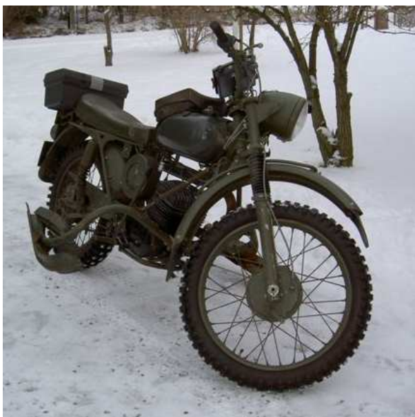
Min gamla krigare, en Husqvarna 256A från 1968 med förlutet på P10 på Gotland, apterad för dagens kamp.

också – rund är ju en rätt fin form. Tusan vad det varma och goá militärgröna mc-stället blivit trångt sedan vår turné på Gotland i höstas! Och varmt är det också när jag sitter inne i slottet och tejpar hop sidorna till min roadbook. Den skulle väl kunna kallas vägbeskrivning, men då låter det ju inte så avancerat och omgivningen skulle kunna tro att det inte är svårt det här. Den används istället för karta.