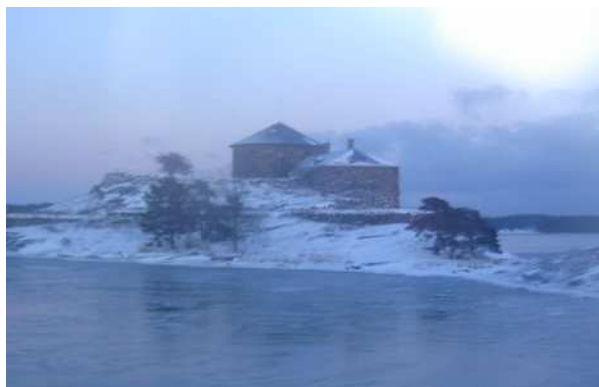
Dalarö skans glider förbi – eller är det kanske vi som glider förbi skansen?

Vi går dock lugnt genom delvis isbelagt vatten rakt mot solnedgången och passerar nära Dalarö Skans. Åsynen av denna gamla försvarsanläggning jämte min gamla krigare, väl surrad på fördäck, ger mig klarhet i en sak;