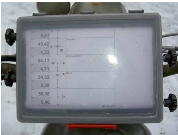
Roadbooken rullas fram vartefter hållpunkterna passeras

också – rund är ju en rätt fin form. Tusan vad det varma och goá militärgröna mc-stället blivit trångt sedan vår turné på Gotland i höstas! Och varmt är det också när jag sitter inne i slottet och tejpar hop sidorna till min roadbook. Den skulle väl kunna kallas vägbeskrivning, men då låter det ju inte så avancerat och omgivningen skulle kunna tro att det inte är svårt det här. Den används istället för karta.