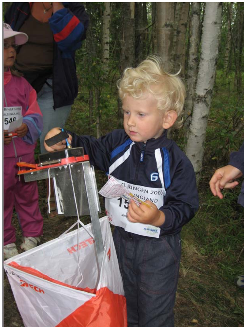
Loke på 5-dagars i Hälsningland 2006