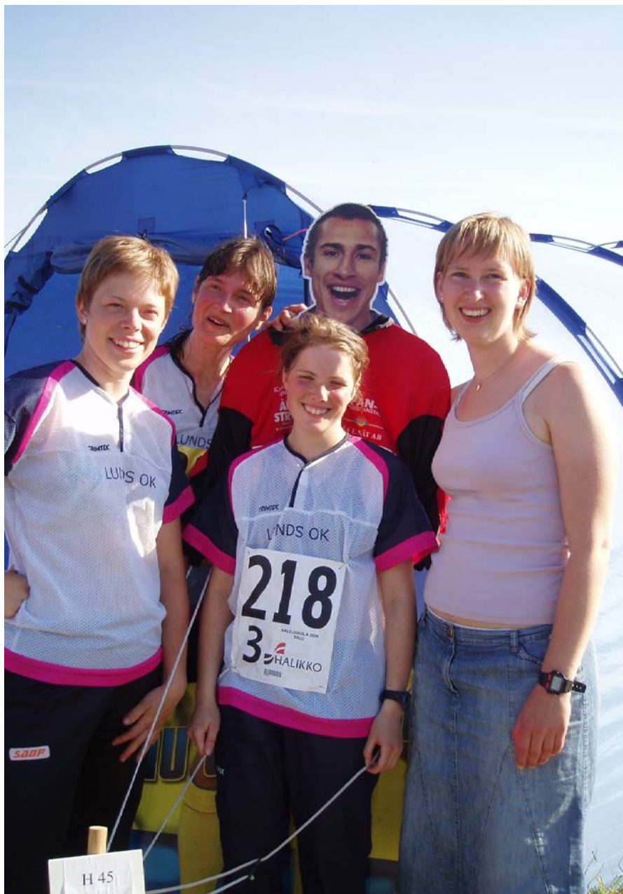
Känd profil överväger klubb-byte