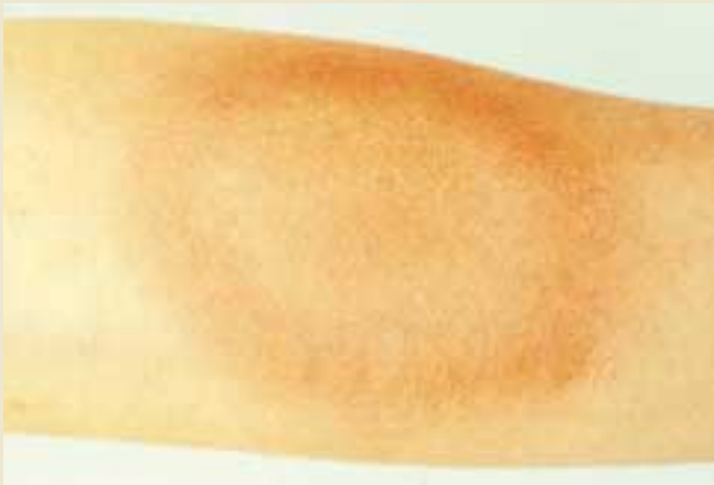
Figur 1. Det typiske sirkulære utslettet erythema migrans er et sikkert tegn på Borrelia infeksjon. Imidlertid kan utslettet ofte mangle eller være atypisk.