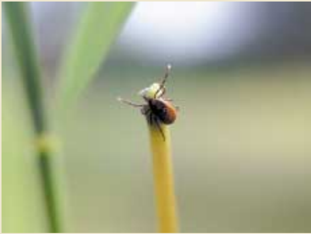
Figur 3. En voksen hunnflått på toppen av et strå på jakt etter et varmblodig individ som den kan sugd blod av. Flåtten er avhengig av blod for å kunne utvikle seg til de ulike stadiene og for at eggene skal modnes. Voksen flått som ikke har sugd blod er 2-3 mm stor, mens hos fullsugd flått er gjerne størrelsen økt til 10 mm. Flåtten kan ikke drikke, eventuell fuktighet får den inn gjennom porer i huden. Den er derfor utsatt for uttørring i tørt vær.

Uheldigvis er det mange (cirka 50 prosent), som ikke utvikler dette typiske utslettet. Ukarakteristiske utslett kan oppstå og føre til problemer med å diagnostisere sykdommen, eller det kan være forsinket utvikling av utslettet fra det normale (2 - 30 dager) til 100 dager etter bitt med smitte av B. afzelii (10). Dette kan da føre til at sykdommen behandles i en sen fase eller ikke i det hele tatt, og dermed fører til kronisk infeksjon. Oftest er det hud, muskler, skjelett, sentrale og perifere nerver, hjerne, hjerte og ledd som affiseres, men det kardiovaskulære system, nyrer, lever, bronkier, lunger, lymfatiske system, øyne, genitalia og mage/tarm affiseres også. Dessuten kan alle vev og organer infiseres, da bakterien raskt kan dissemilere til fjerntliggende steder (6,11).